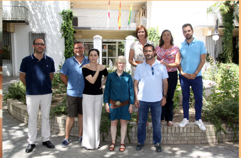
Jurado Certámenes Literarios-2017