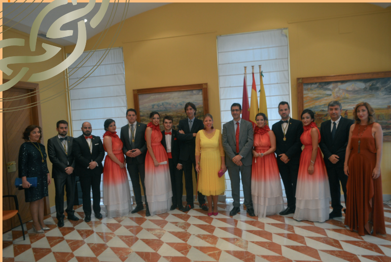
Autoridades, Mantenedor, Madrinas y Padrino 2017