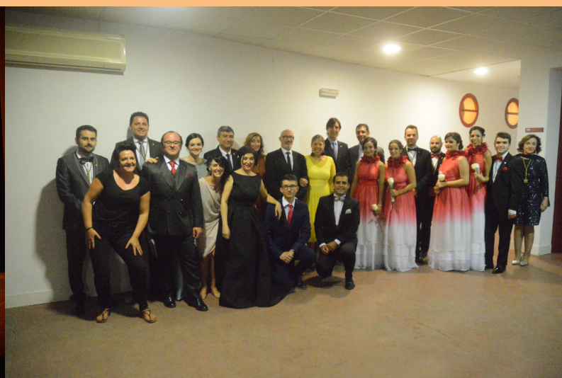
Autoridades, Mantenedor, Madrinas, Padrino y "Carpe Diem Teatro" (Presentadores 2017)