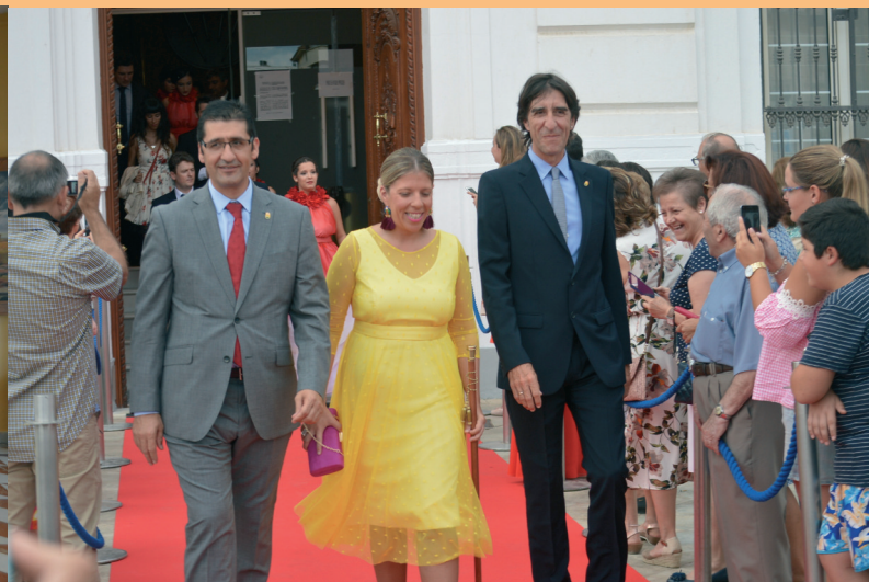
Presidente de la Diputación Provincial de C. Real, Alcaldesa de Tomelloso y Mantenedor 2017