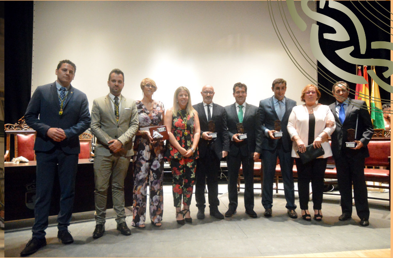
Viñadores 2017 y Autoridades