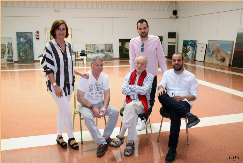
Jurado Certámenes Artísticos-2017